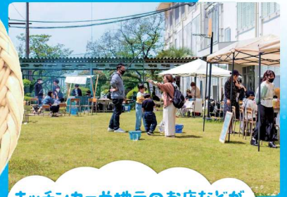
キッチンカーや地元のお店などが 集まったマルシェ